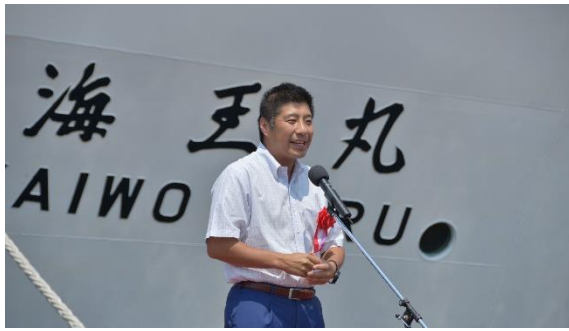
森 智広 四日市市長