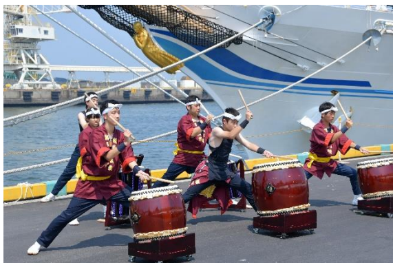
3日午後に、海王丸の前で諏訪太鼓の演奏を披露していただきました。