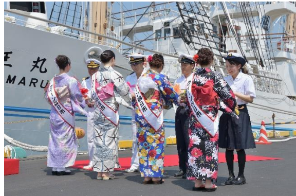
クイーン四日市から船長、機関長、実習生へ