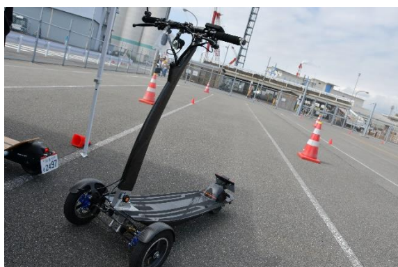
フヂイエンジニアリング株式会社

電動キックボード「SUNAMERI」の展示及び試乗体験を実施していただきました。