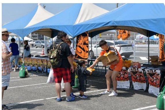
ヴィアティン三重

「ヴィアティン三重応援カレー」を配布する等、会場各地を盛り上げていただきました。