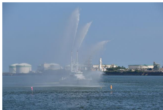
一般公開終了後、カッターレース大会海域付近で放水