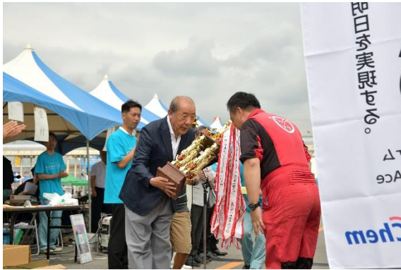
一般の部 T.I.T CUTTER CLUB 女子の部 Star Dust Ladies (*各部の前回大会優勝チーム)