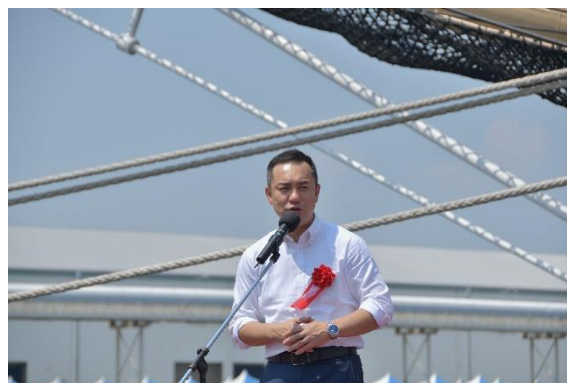
四日市港管理組合管理者 鈴木 英敬 三重県知事