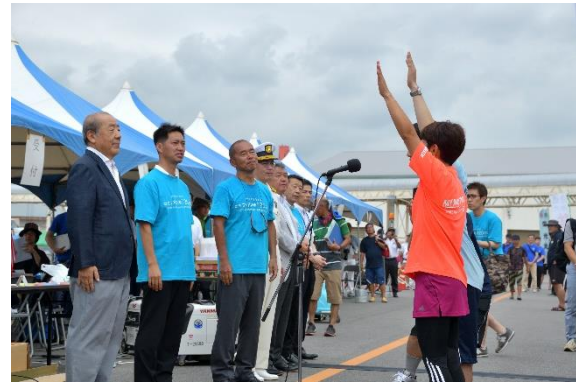
一般の部 ネオケム Team One 女子の部 MY MOTHERS LADIES (*各部の第1レース第1コース出場チーム)