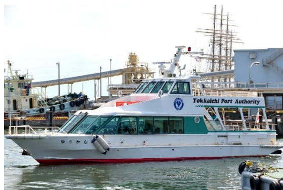
はがきによる事前募集 (当選者数175名／応募総数239名)