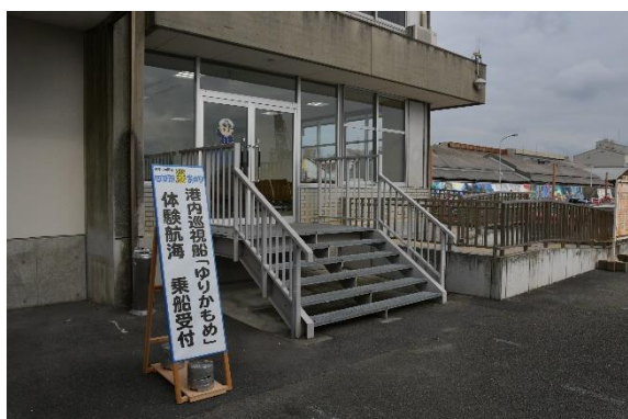
埠頭ビル1Fの船員船客待合所にて乗船受付