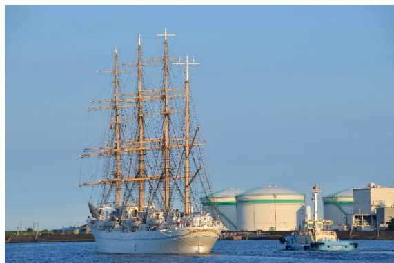
台風接近のため、予定を早めて4日夕方に出港しました。