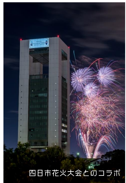
四日市花火大会とのコラボ