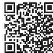
四日市市 安全安心防災メール