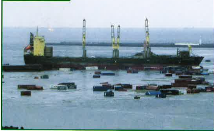
(東日本大震災 青森県八戸港の状況)