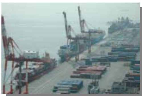
霞ヶ浦地区南埠頭