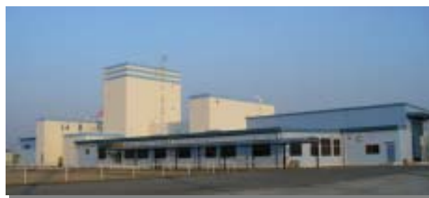
四日市コンテナ検査センター