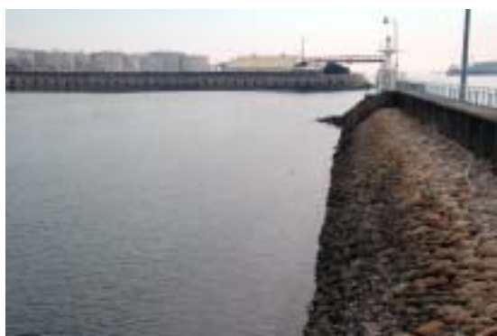
旧港西防波堤（右）と潮吹き防波堤（奥）