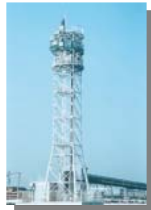
ハーバーインフォメーションシステム (HIS)