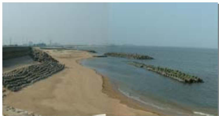
楠・磯津地区（吉崎海岸）