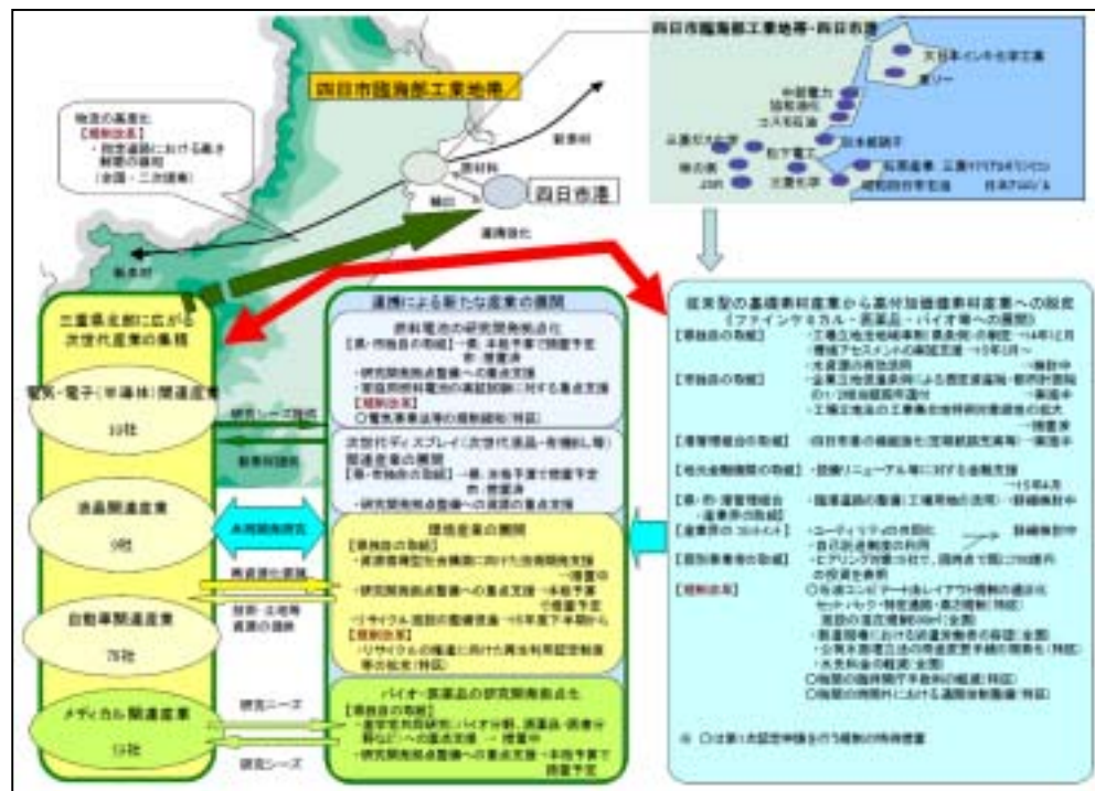
資料：「第1回認定された構造改革特別区域計画」首相官邸HP 技術集積活用型産業再生特区