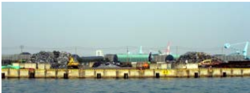
循環資源（金属くず）の取扱