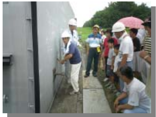
防潮扉の閉鎖に関する説明風景