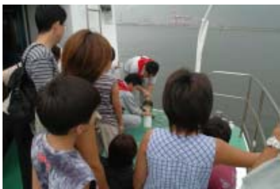
啓発活動(環境学習)の状況