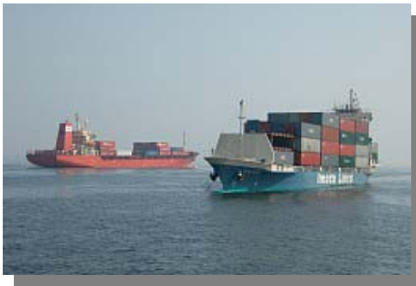
行き交うコンテナ船