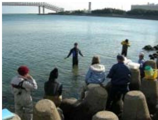
県と市民によるアマモの種まき実験