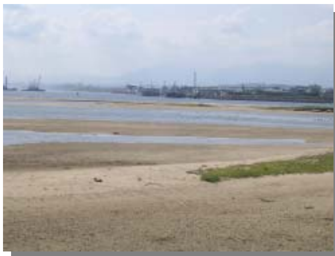
朝明地区の自然干潟