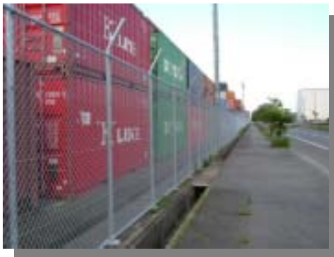
S O L A S 条約によるフェンス