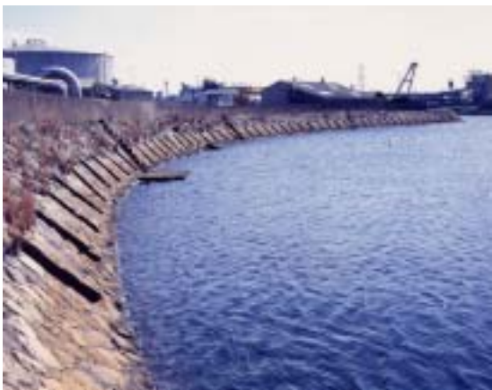
重要文化財に指定された「潮吹き防波堤」