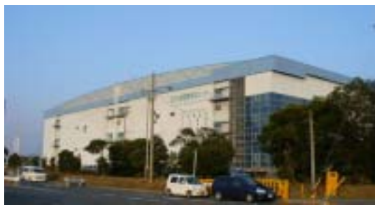
四日市港国際物流センター