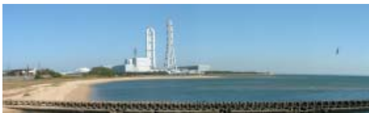
朝明地区（高松海岸）