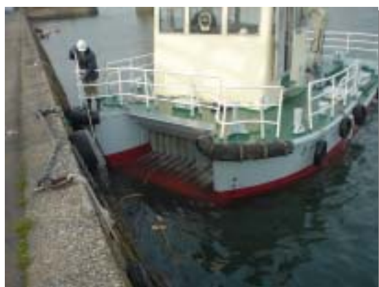
清掃船の活動状況