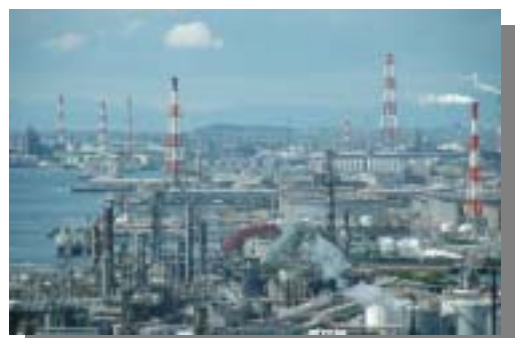
四日市コンビナート