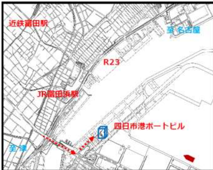
霞ヶ浦地区南埠頭24号岸壁