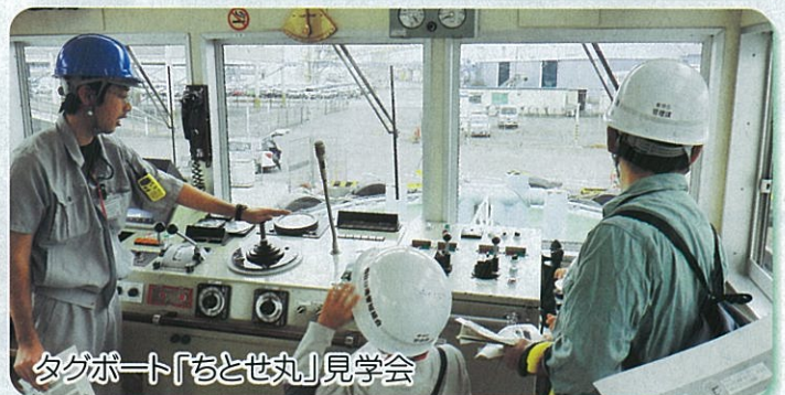
タグボート「ちとせ丸」見学会