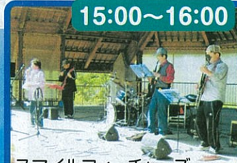
スマイルフィーチャーズ