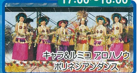
キャラ&ルミコ アロハノウ ポリネシアンダンス