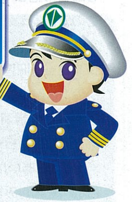
マスコット ポルテ君