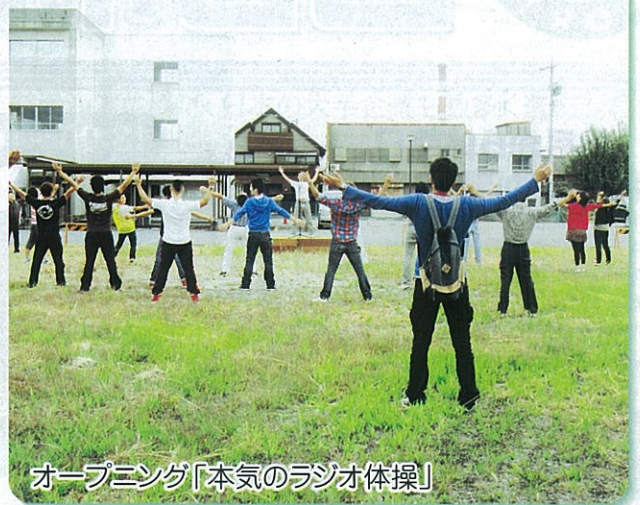
オープニング「本気のラジオ体操」