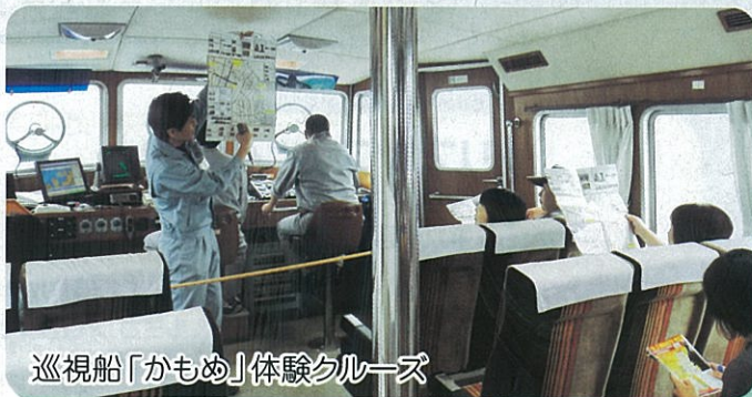
巡視船「かもめ」体験クルーズ