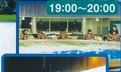
Happy Clover & With Cecilmermaid