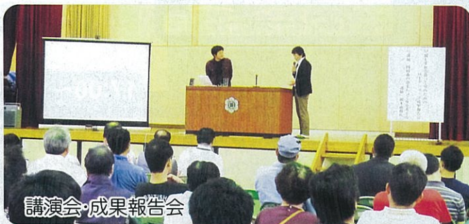
講演会・成果報告会