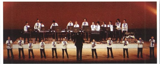
四日市ジュニア・アンサンブル