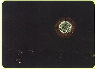
四日市花火大会見学会