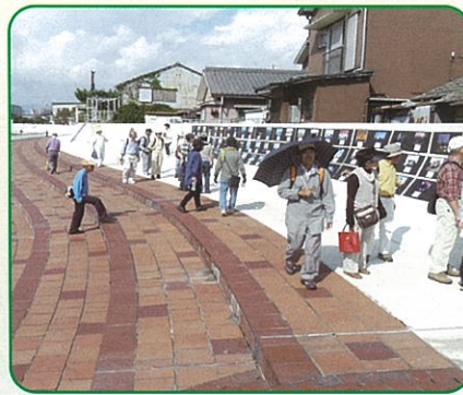
四日市港の魅力写真コンテスト