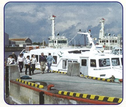
港内巡視船「かもめ」体験クルーズ