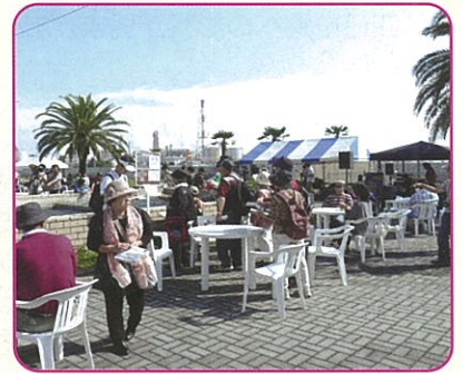
野外音楽イベント