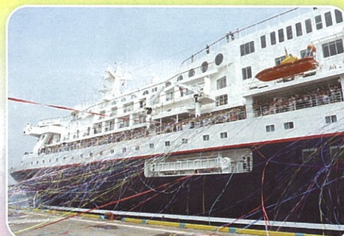
8月17日 出港時にはテープ投げが行われました

にっぽん丸は12月にも四日市港に入港予定です。四日市港管理組合のホームページでもお知らせしますので、ぜひご確認ください。