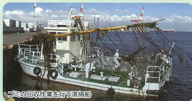
ゴミの回収作業を行う清掃船