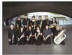
サイレント・プラス・アンサンブル