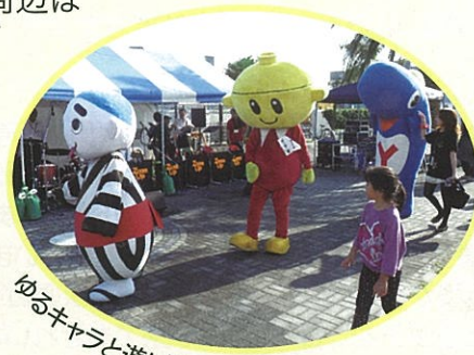
ゆるキャラと遊ぼう