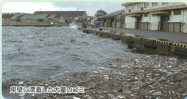
岸壁に漂着した大量のゴミ