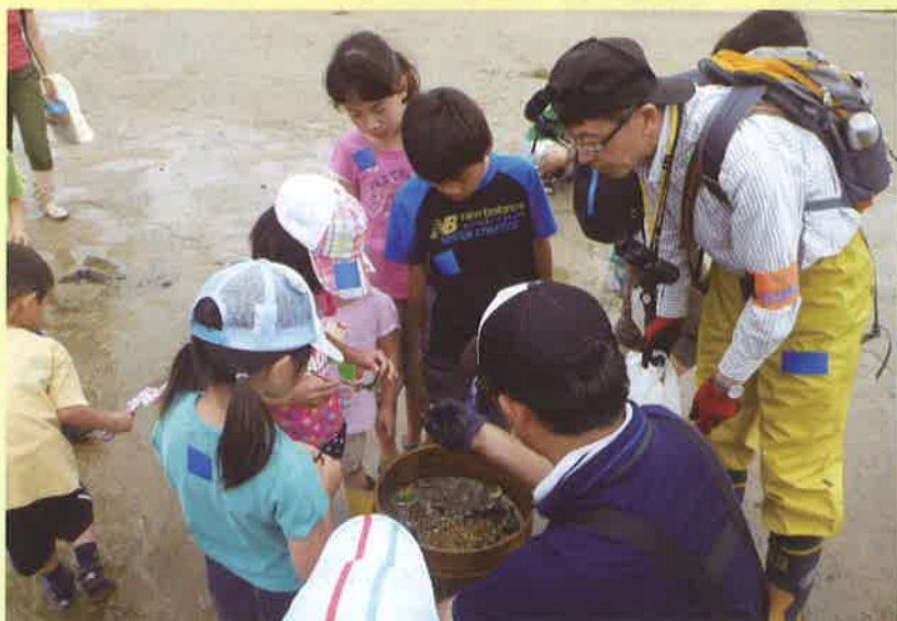
講師の説明を受ける参加者

6月28日(土)に、四日市港に残る干潟「高松干潟」で開催し、小学生と保護者の約50人が参加しました。参加者は、カニ、貝、魚など干潟に住む生き物の観察や、二枚貝が海水を浄化する実験などを通して、干潟の役割や重要性について学びました。四日市港管理組合では「環境にやさしいみなと・四日市港」づくりを進めていくために、今後も環境に関する様々なイベントを開催していきます。なお同観察会は来年度も開催予定です。開催案内などについては「四日市港管理組合のホームページ( http://www.yokkaichi-port.or.jp/ )や「広報よっかいち」でご案内します。