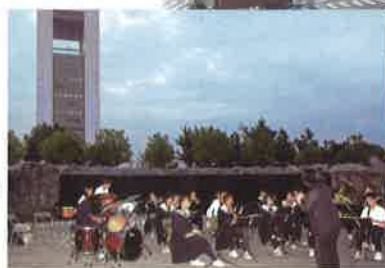
円形のステージを利用したコンサートの様子