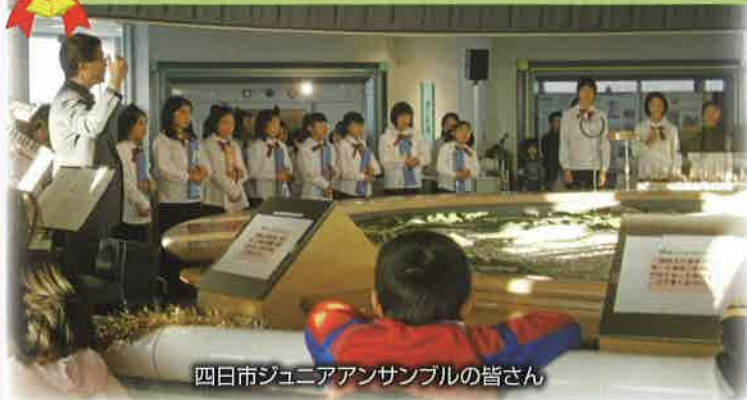
四日市ジュニアアンサンブルの皆さん

展望展示室「うみてらす14 (フォーティーン)」では、12月20日(土)にクリスマスコンサートを開催します。当日は、展望展示室を終日無料開放しますので、皆さんお誘いあわせの上、ぜひご来館ください。