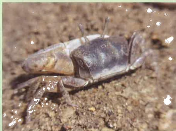
ハクセンシオマネキ

四日市港霞ヶ浦南ふ頭～町道川越中央線(臨海橋)を結ぶ約4.1kmの臨港道路(霞4号幹線)の整備を、国土交通省の直轄事業で進めています。