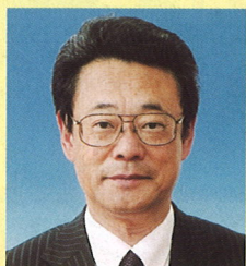
副議長 毛利 彰男 (市議会選出)