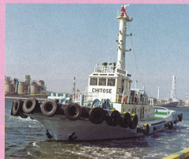
タグボート「ちとせ丸」