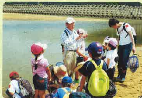
<講師の説明を受ける参加者>

四日市港管理組合では「環境にやさしいみなと・四日市港」づくりを進めていくために、今後も環境のイベントを開催していきます。