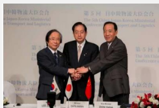
前回日本開催時の様子 (2014年8月・横浜)