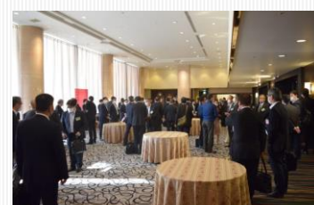
名刺交換会の様子