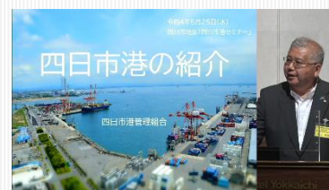
四日市港のプレゼン