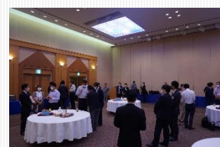
名刺交換会の様子