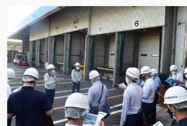
冷凍冷蔵倉庫の見学