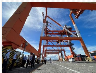
コンテナターミナルの見学