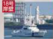
18号岸壁 巡視艇 あおたき