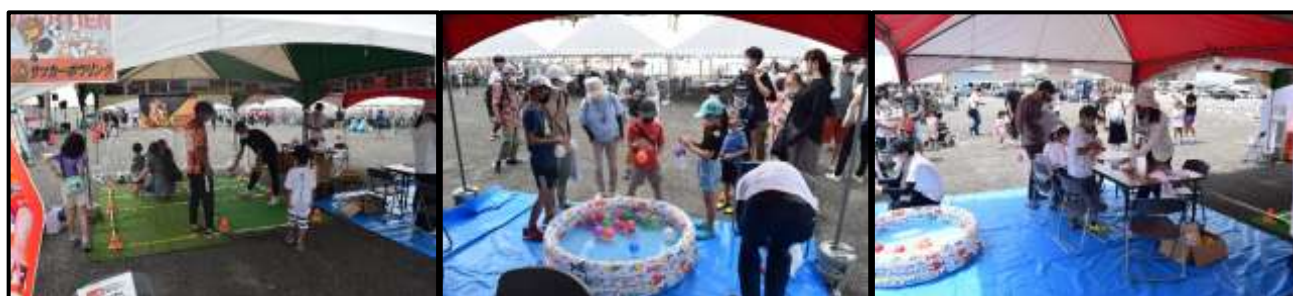
サッカーボーリング