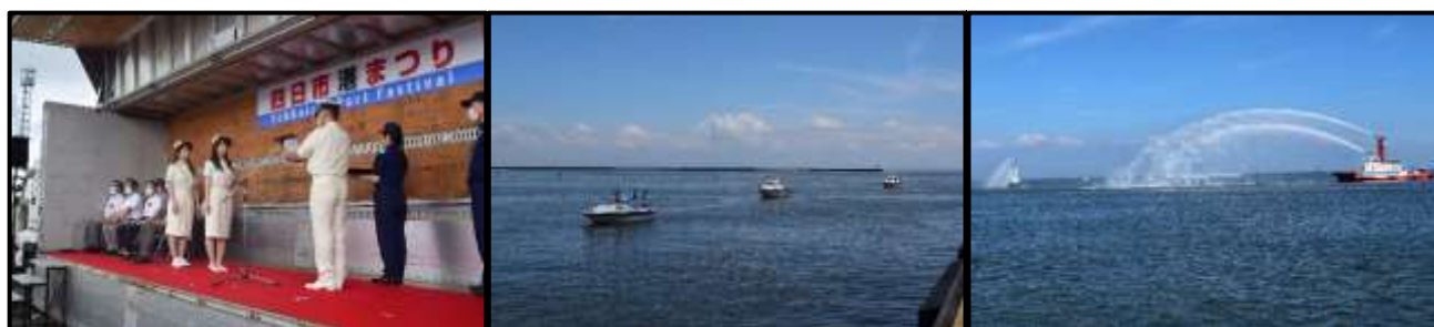
一日海上保安部長等任命式