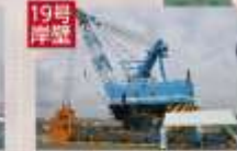
19号岸壁 クラブ渡洋船兼起重機船 27金剛