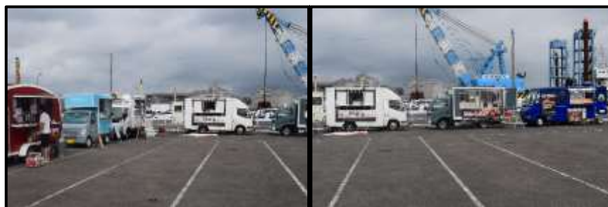
キッチンカーの様子