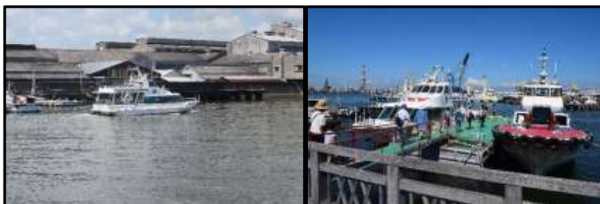
ゆりかもめ体験航海の様子