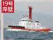
19号岸壁 化学防災船 てんおう