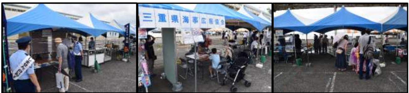
展示ブースの様子