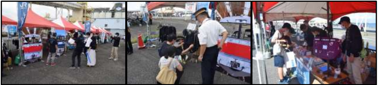
鉄道グッズマルシェの様子