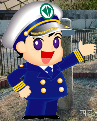
四日市港マスコットキャラクター ポルテくん

※ゆりかもめは乗船場所の構造上、バリアフリーに対応していませんのでご注意ください。